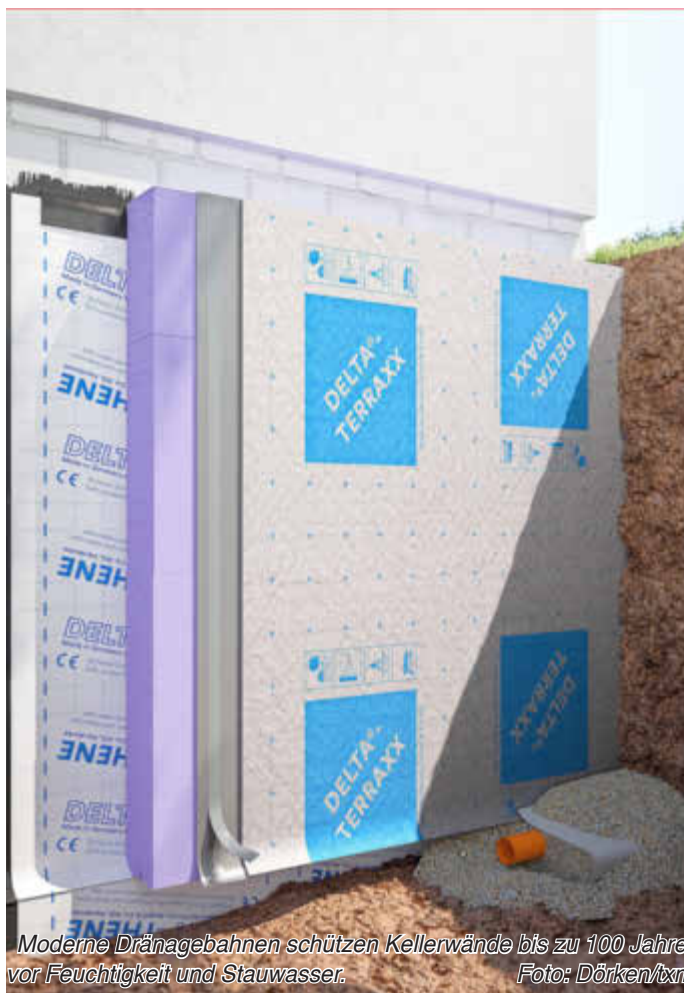
Moderne Drainagebahnen schützen Kellerwände bis zu 100 Jahre vor Feuchtigkeit und Stauwasser.

www.schreinerei-wehr.de • Gutenstetten • 09161 / 6631940